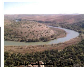
صورة 7: سد بولعوان