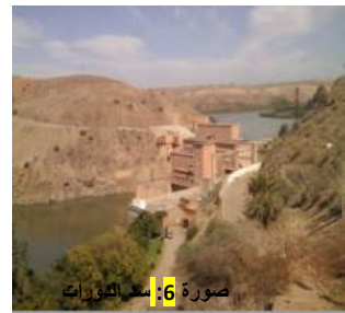
صورة 6: سد الدورات