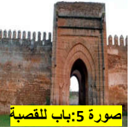
صورة 5: باب للقصبة

تعتبر 'بولعوان'، منطقة فلاحية بجنوب دكالة، اشتهرت بترتبتها الرملية التي تستغل في غراسة الكروم بشكل تقليدي. وتشتهر بولعوان بقصبتها التاريخية و سد الدورات المتميز بتنوعه الجغرافي، الذي يظم بنية طبيعية ملفتة المشاهد من نهر وغابة. وهي مؤهلات سياحية كقابلة بخلق نشاط سياحي قروي متميز يعتمد أساسا على القيمة التاريخية المعمارية للقصبة، في حين تشكل المناظر الطبيعية الخلابة المحيطة به إحدى الدعائم الممكن استثمارها لجعلها قبلة سياحية، فما هي المقومات الطبيعية والسياحية لمنطقة بولعوان؟ وما الإكراهات التي تعيق تنميتها وأفاق تطويرها؟