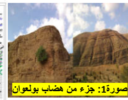
صورة 1: جزء من هضاب بولعوان