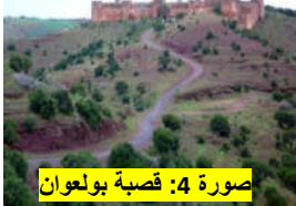
صورة 4: قصبة بولعوان