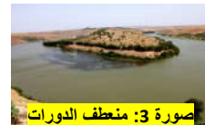
صورة 3: منعطف الدورات

يأخذ أم الربيع منبعه في الجزء الملتوي جنوب الأطلس المتوسط الهضبي، ويستمر النهر في الجريان قاطعا مناطق جغرافية متباينة، وتغذية روافد يجلبها على الضفة اليسرى، كواد العبيد، وتساوت... يدخل المجال المدرس مشكلا الحدود بين دكالة في الجنوب والشاوية في الشمال، ويزيد تعمقه حيث يتراوح بين 100 و130م، ويتخذ الجريان اتجاها من الجنوب الشرقي نحو الشمال الغربي، فحالة يشكل فيها النهر ضفة يسرى يغلب عليها طابع التقعر، وحالة يشكل فيها ضفة اليمنى تتكون من منعطفات واسعة تضيق جنوب مركز بولعوان، كما هو الشأن في منعطف قصبة بولعوان، ثم تتسع هذه المنعطفات في اتجاه الشمال.